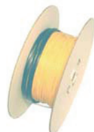
HandyCable DVC-10 - 10 Watt/meter